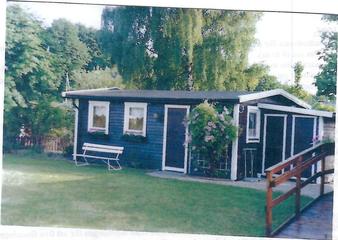
Klubbstugan med sina två toaletter till höger.