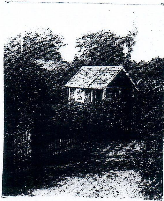
Så här kunde den första kolonistugan se ut.