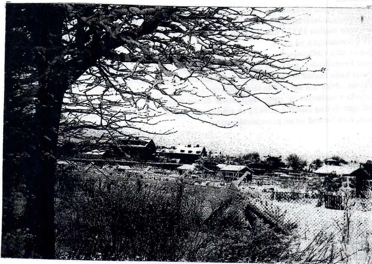
Ett vintermotiv tagit över koloniområdet runt 1950. Bilden är sannolikt tagen från Fredriksdalsskogen.

Likasa inhandlades gräsklippare, skottkärror samt en häcksax.