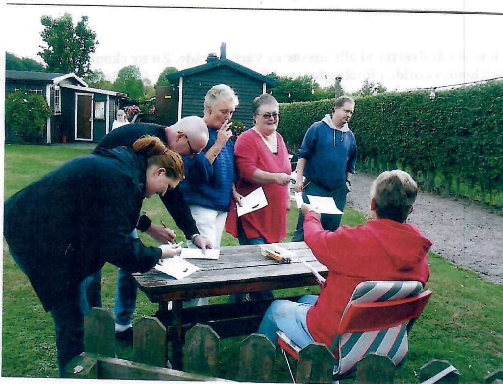
Tipspromenad på gång.