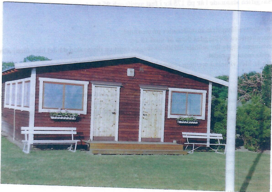
Dansbanan är nu färdigbyggd.