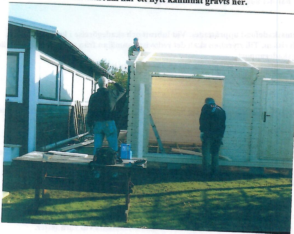
Förrådsbyggnaden börjar ta form.

Längs med Fredriksdals museum har ett nytt kaninnät grävts ner.