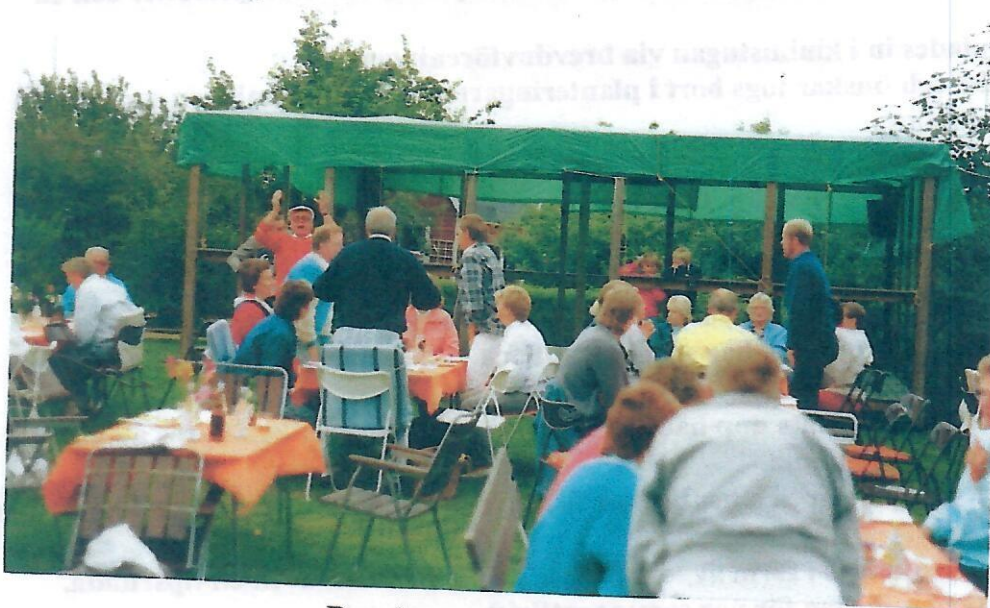
Dansbanan anno 1984.

En takstomme på dansbanan har tillverkats för att kunna lägga presenningar över, vid dåligt väder. Förvaringslådor har gjorts och ett skåp att förvara gasolflaskor har inköpts. Även ett par brandsläckare har köpts in. Lugguddegilletts folkdanslag kommer till midsommar att leda midsommardansen samt ha en uppvisningsdans.