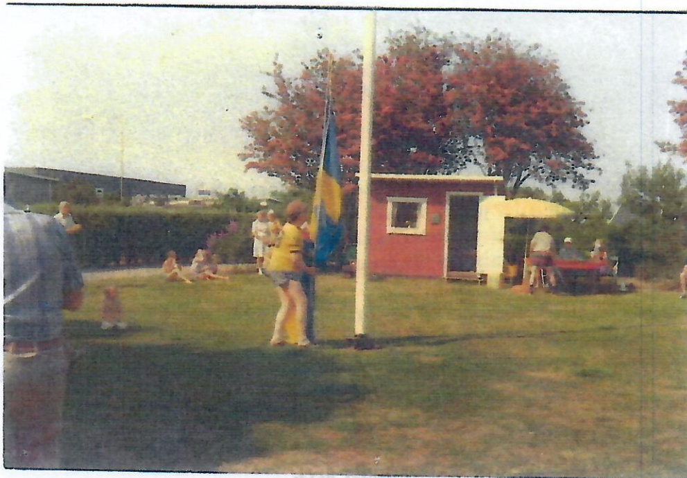
Den nya flaggstången invigs. I bakgrunden den gamla klubbstugan.