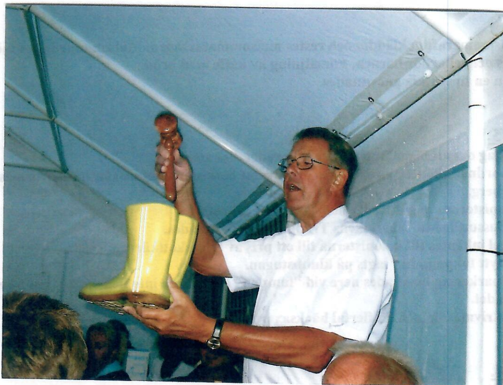
Vem bjuder 20 kronor för stövlarna?